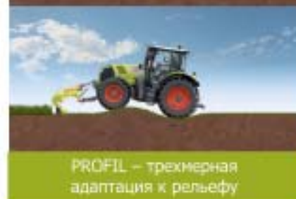
PROFIL – трехмерная адаптация к рельефу