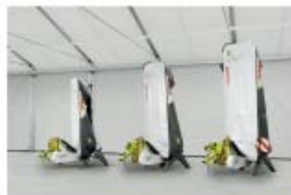
Опционально поставляемые подмости позволяют хранить задненавесные косилки DISCO в чистоте