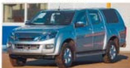
фото из архива компании «Омскдизель» ▲

«Омскдизель» – сервисные услуги мирового уровня!