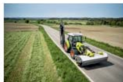
Компактное положение при транспортировке