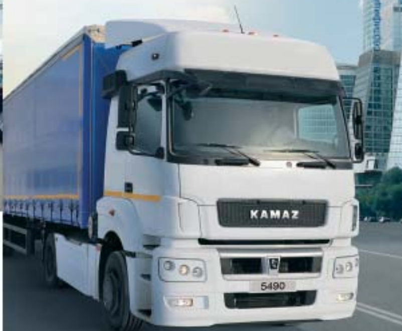
KAMAZ - 5490

КАМАЗ-центр компании «Омскдизель» – это профессиональный коллектив, лучшая техника, качественные услуги, индивидуальный подход и ответственность перед заказчиком.