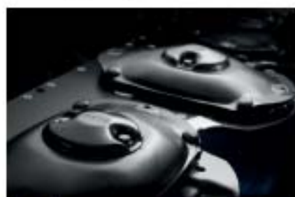
Профессиональное оборудование MAX CUT в задненавесных косилках с боковым навешиванием

Дисковые косилки DISCO отличаются оптимальным копированием рельефа поверхности почвы независимо от условий уборки, а также чистым и энергоэффективным скашиванием. Благодаря косилочному брусу MAX CUT данные косилки оставляют идеальный рисунок среза. А благодаря системе ACTIVE FLOAT достигается экономичный расход дизельного топлива и экономичный вал отбора мощности.