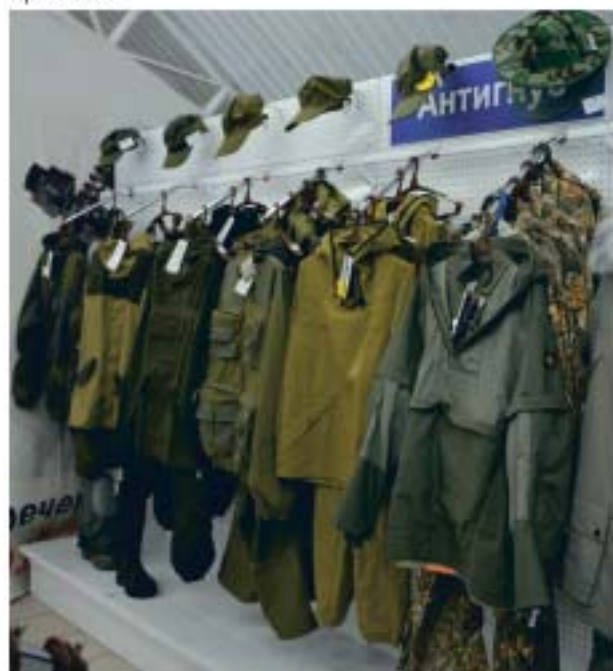
Фото из архива компании «Омскдизель» ▲

«Омскдизель» помогает экономить время и деньги, чтобы вы могли сосредоточиться на своем бизнесе, решении рабочих вопросов и получении прибыли.