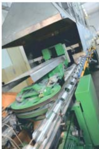
Фото из архива компании «Омскдизель» ▲

В планах предприятия – подготовка и запуск цеха цельномолочной продукции мощностью переработки до 200 тонн в сутки.