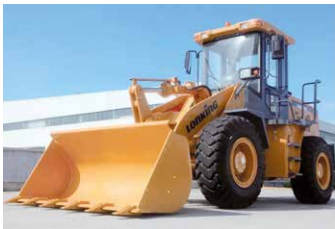
Фронтальный погрузчик Lonking LG833N