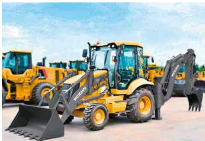
Экскаватор- погрузчик WLB468-II