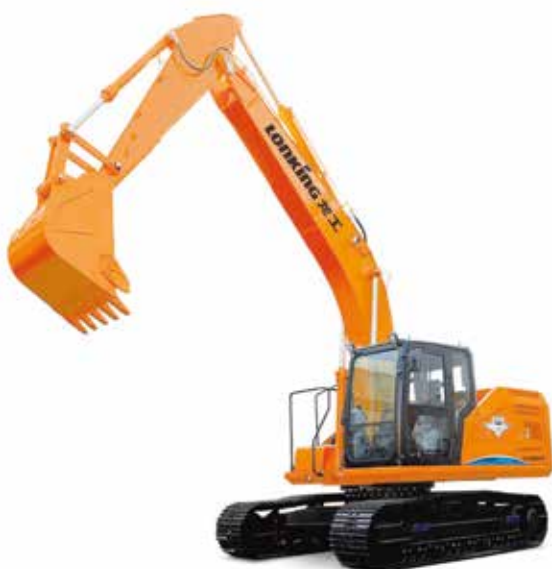
Экскаватор Lonking CDM6225